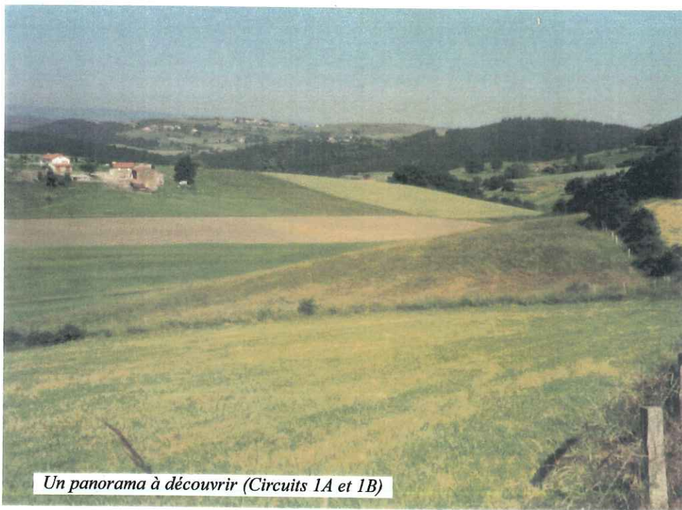
Un panorama à découvrir (Circuits 1A et 1B)

Après avoir rejoint la rue Buisson, tournez à gauche en direction de l'église.