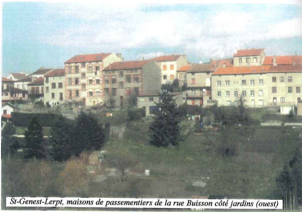
St-Genest-Lerpt, maisons de passementiers de la rue Buisson côté jardins (ouest)